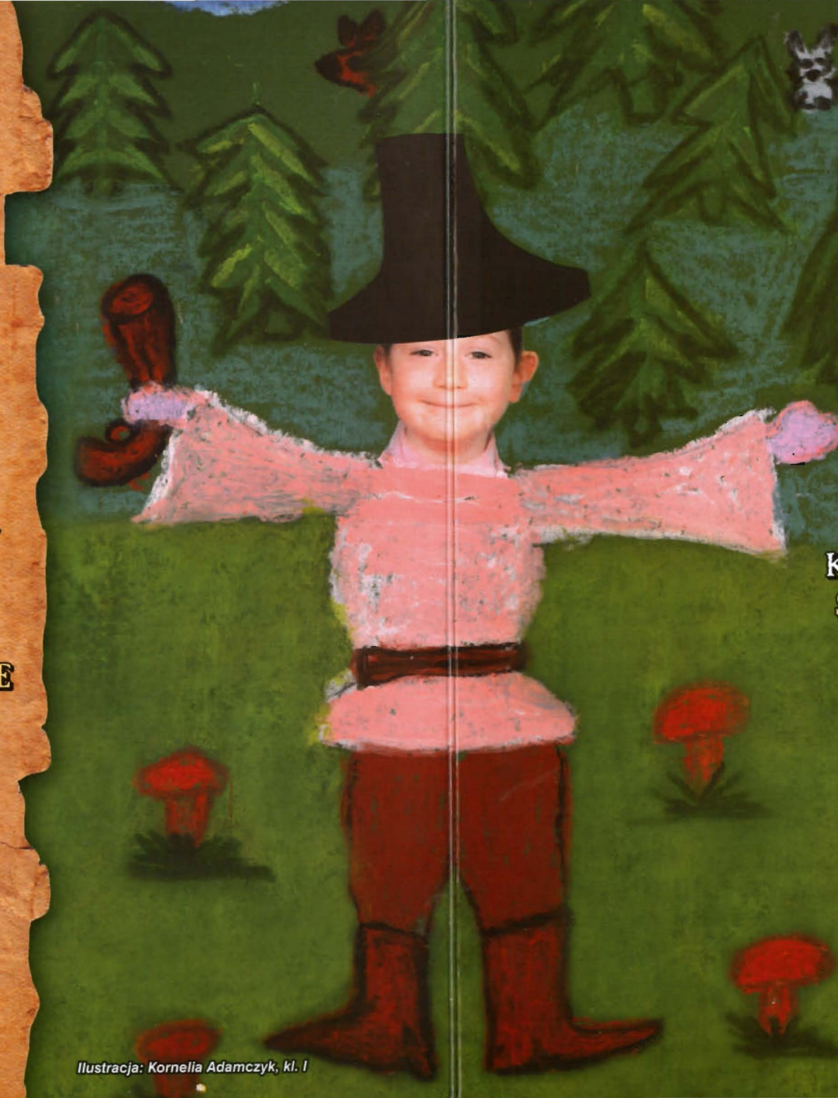
Ilustracja: Kornelia Adamczyk, kl. I