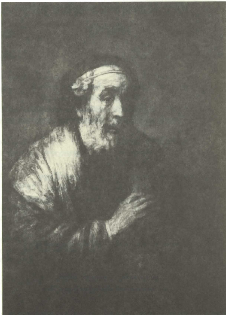
Rembrandt, Homer, muzeum Mauritshuis, Haga

„U kolebki literatury greckiej pojawiają się dwie wielkie epepeje: Iliada i Odyseja . Jako ich autora wymienia zgodnie tradycja starożytna Jończyka Homera, ale o jego osobie nic pewnego nie wie, przekazuje tylko potomności całkiem sporą liczbę jego zmyślonych żywotów. Nie wiadomo nawet, jakie miasto greckie lub jaka wyspa wydała na świat Homera. Podobno aż siedem miast w starożytności toczyło między sobą nieustające spory o wyjątkowy zaszczyt nazwania się ojczyzną znakomitego poety. Starożytni jednak nie tylko nic nie wiedzieli o miejscu jego urodzenia, ale nie znali też, co gorsze, czasu na który przypadło jego życie. Niektórzy jak znany geograf, Erastostenes z Cyreny (III w p.n.e.), utrzymywali, iż był on współczesny wydarzeniom, które w swoich poematach opisuje, co znaczy, że żył w okresie ok. 1200 r p.n.e. Inni natomiast, a tych było bez wątpienia więcej, skłaniali się do opinii historyka Herodota (V w p.n.e.), popartej do pewnego stopnia przez innego historyka, Tukidydesa (nieco młodszego od Herodota), która kładła żywot Homera w trzy wieki po zdobyciu Troi, tj. na IX w p.n.e..