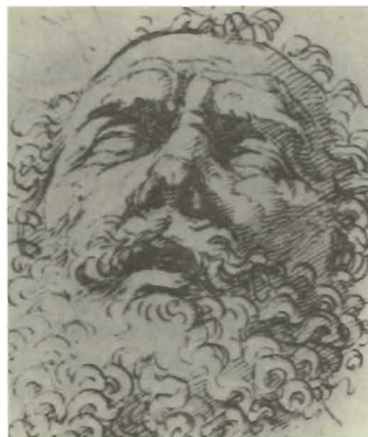
Rafaël, Homer, szkic do Parnasu