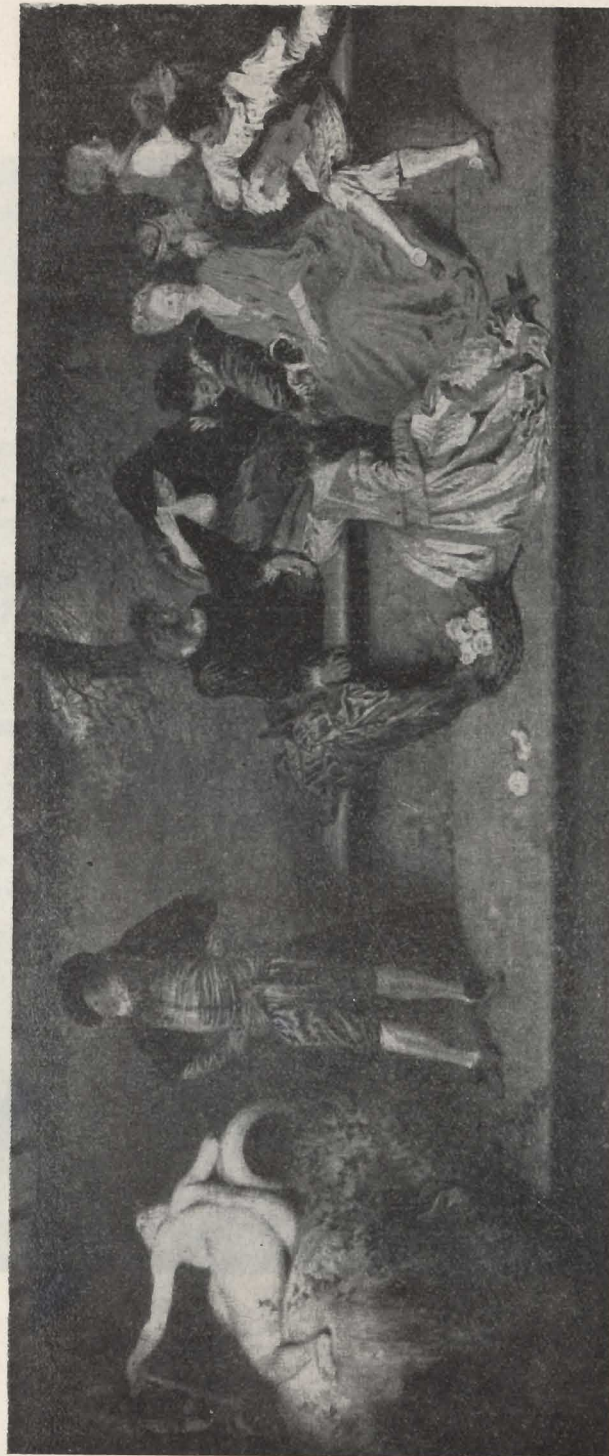
Antoine Watteau (1684—1721) Réunion dans un parc