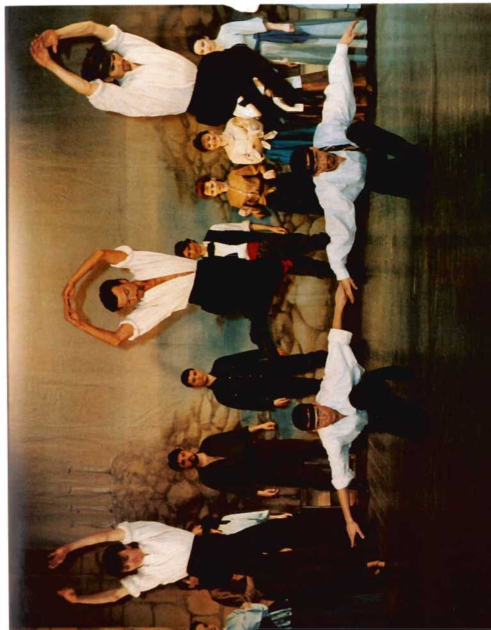
J. Kander „Zorba” zespół baletowy i chór