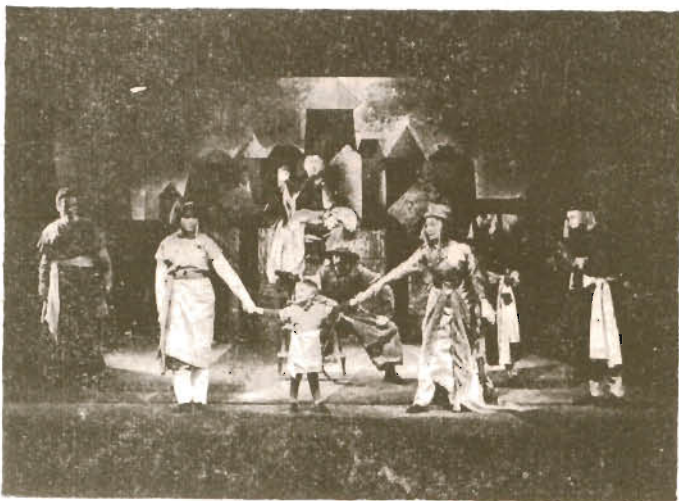
KAUKASKIE KREDOWE KOŁO — B. Brecht reż. K. Braun — premiera 15. II. 1963