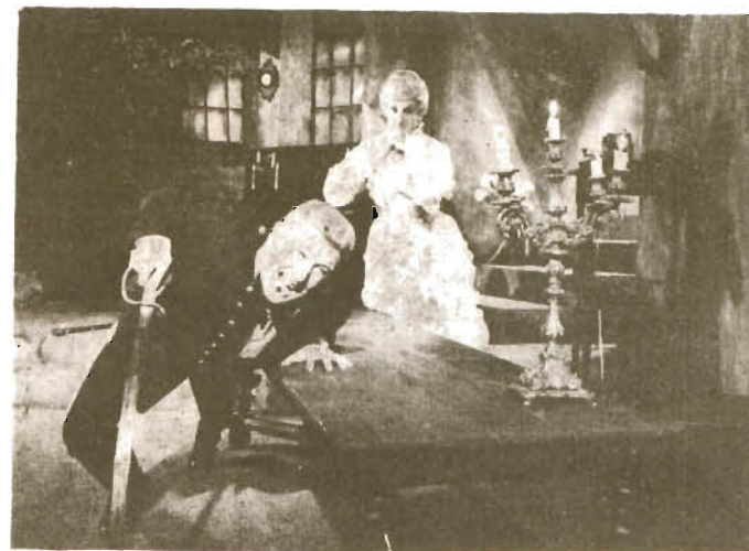
SMIERTELNY TANIEC — A. Strindberg re. P. Paradowski — prem. 22. IV. 1967