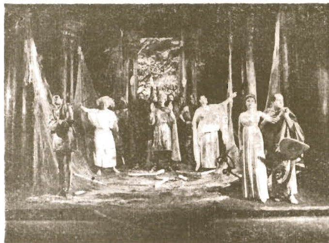
ROMULUS WIELKI — F. Dürrenmatt reż. P. Paradowski — prem. 26. II. 1966

(...) Tendencje „surnaturalistyczne” najwyraźniej występują w scenografii Jadwigi Pożakowskiej, która pracuje tu od 1961 r.