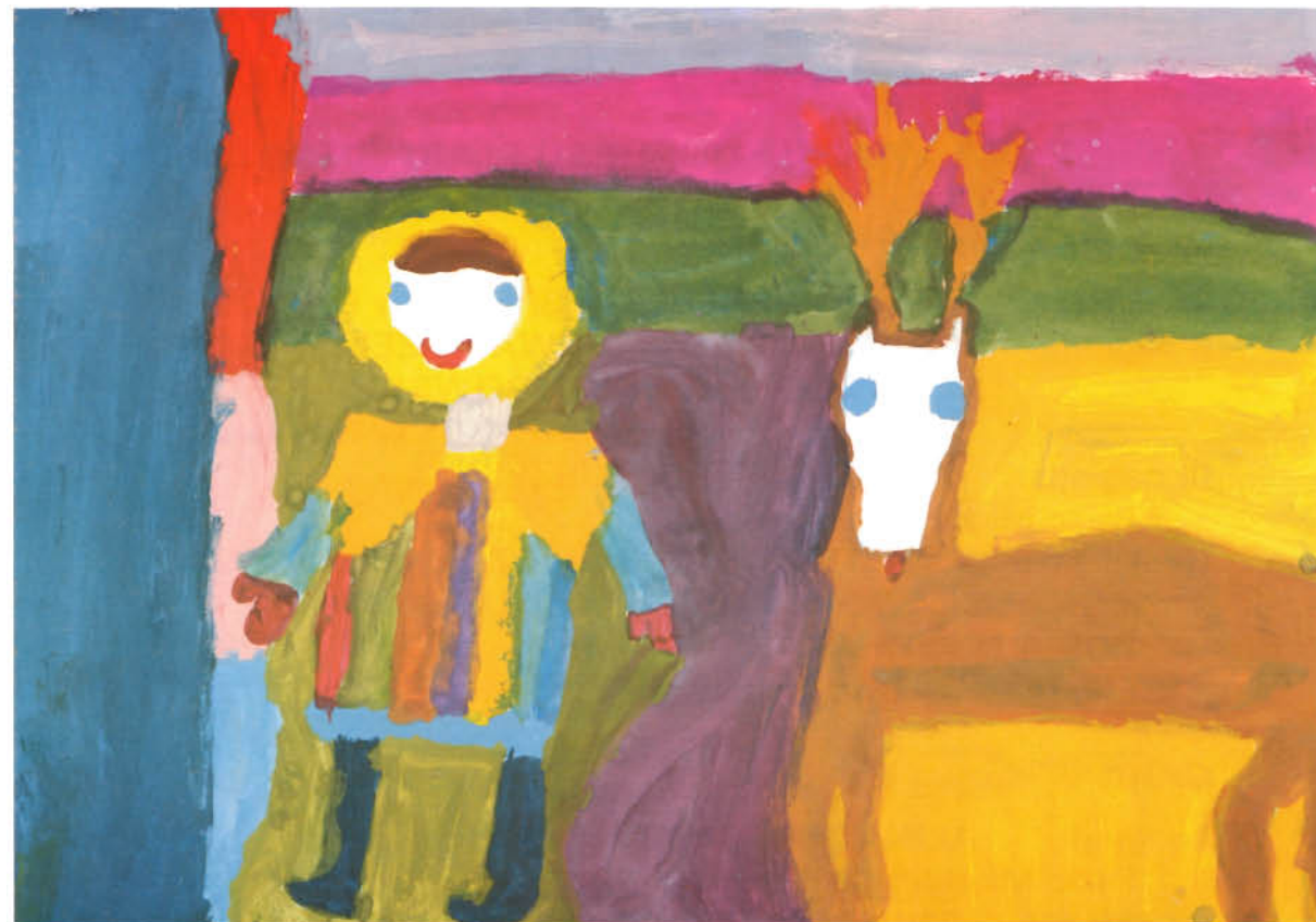
ALINA JURCZYSZYN — „Gerda wyrusza na poszukiwanie Kaya” /I nagroda w grupie wiekowej 5 — 8 lat/ Pałac Młodzieży w Gdańsku