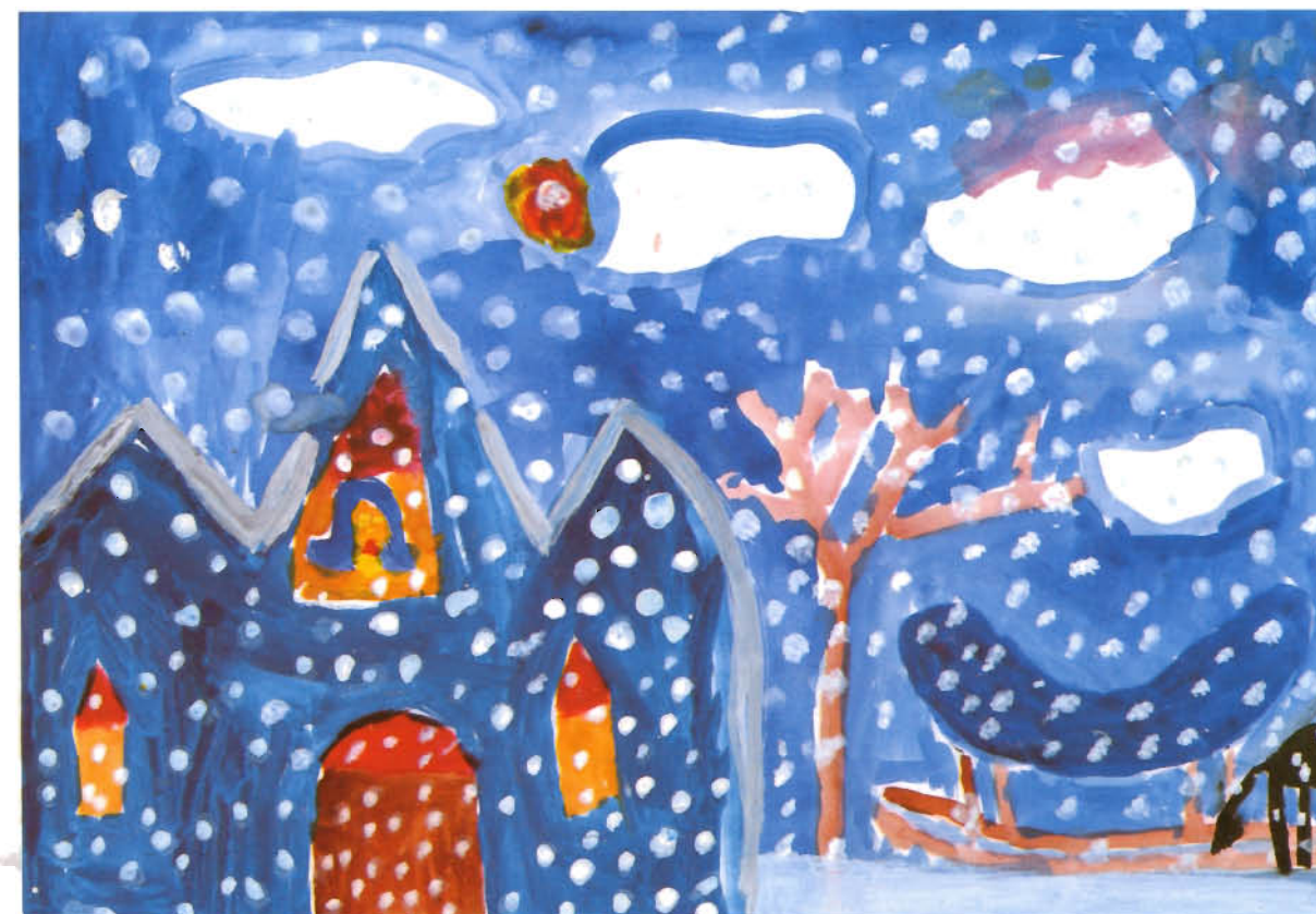
ANNA ŁUKIEWSKA — „Królowa Śniegu w zimowym pałacu i jej sanie” /II nagroda w grupie wiekowej 5 — 8 lat/ Szkoła Podstawowa nr 93 w Gdańsku