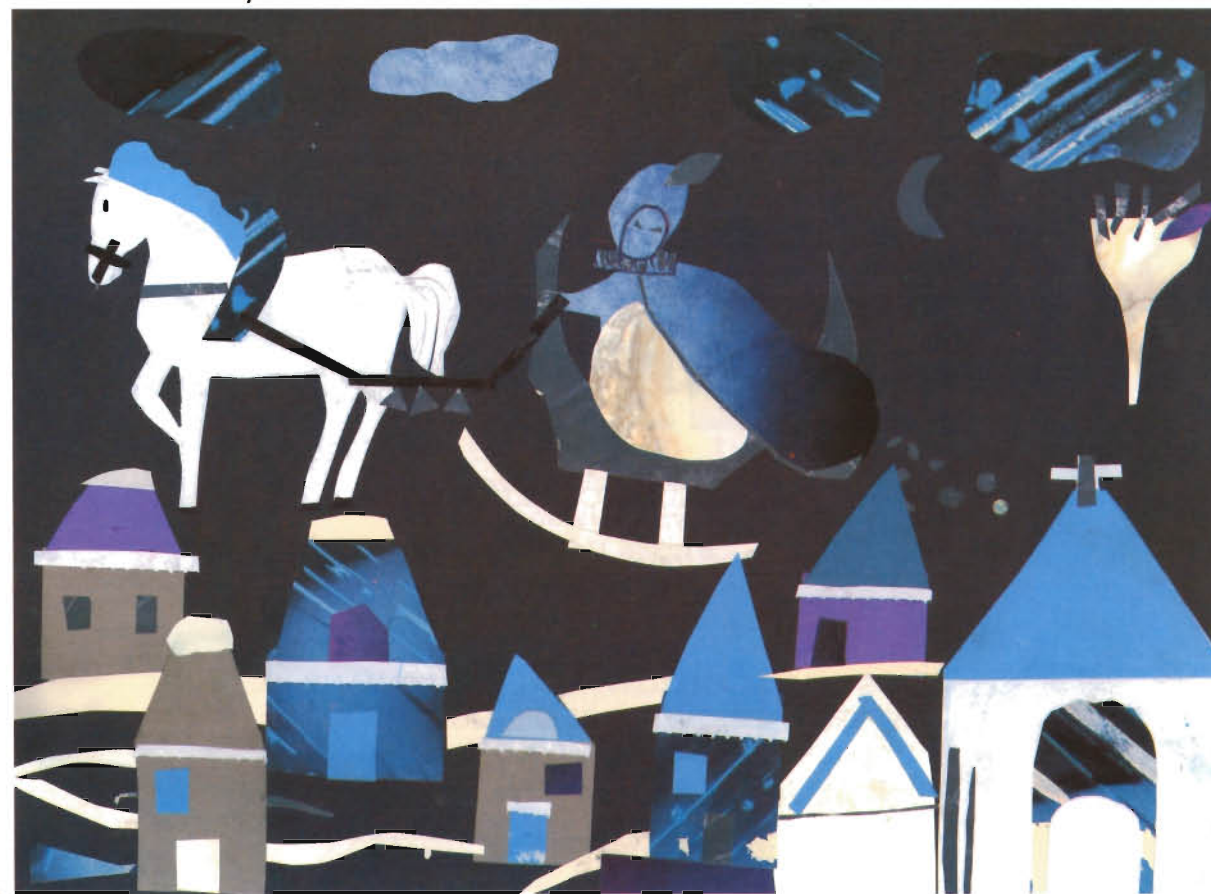
PRACA ZBIOROWA /AGATA BALEWICZ, EWA KRZEZIŃSKA, KAROLINA KASZUBOWSKA/ — bez tytułu /II nagroda w grupie wiekowej 8 — 12 lat/ Sportowa Szkoła Podstawowa nr 35 w Gdańsku