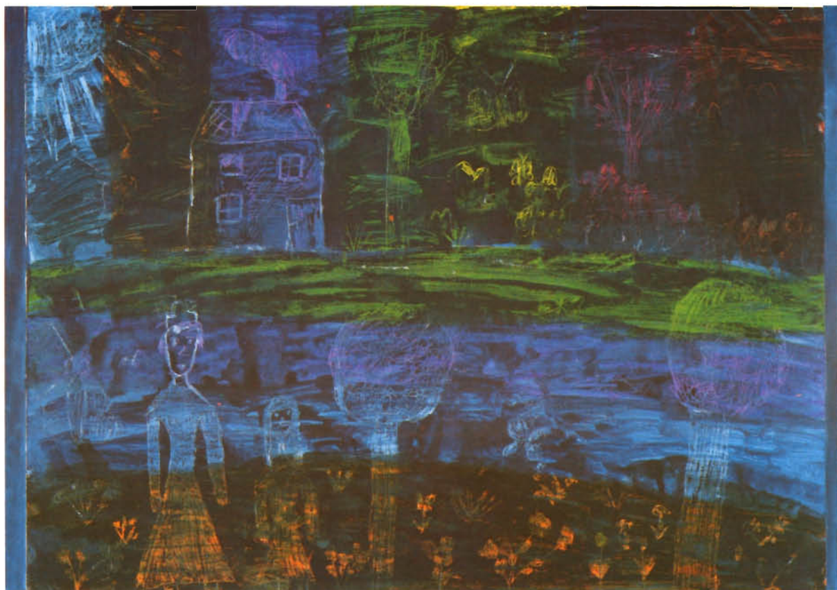
MAŁGOSIA MELIBRUDA — „Gerda w gościnie u staruszki” /III nagroda w grupie wiekowej 5 — 8 lat/ Szkoła Podstawowa nr 93 w Gdańsku

„...Staruszka zaprowadziła Gerdę do ogrodu. Jakżeż tam pachniało i jak tam było pięknie! Wszystkie kwiaty, jakie tylko rosną o każdej porze roku, rozkwitały tu wspaniale; żadna książka z obrazkami nie mogła być barwniejsza i piękniejsza. Gerda skakała z radości i bawiła się, dopóki słońce nie zaszło pomiędzy wysokimi wiśniami...”