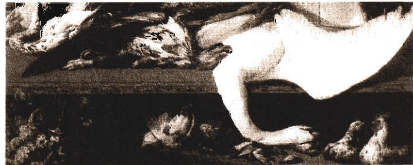
Frans Snyders Martwa natura , fragment

Koło życia i śmierci , wybór Philip Kapleau, Paterson Simons. przekł. Zbigniew Miłunski, Wydawnictwo „Pusty Obłok”, Warszawa 1986, s.24-25.